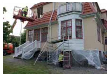
Tryckfelsnisse spökade i nr 4 Rätt bild till texten Fornboda: Här målas fönster och fasader.

Nästa nummer av medlemsbladet kommer ut omkring 28 januari 2016. För att hålla dig uppdaterad om vad som händer på Museet och vilka aktiviteter som pågår besök vår hemsida www.lidingohembygd.se Du kan också följa oss på Facebook.